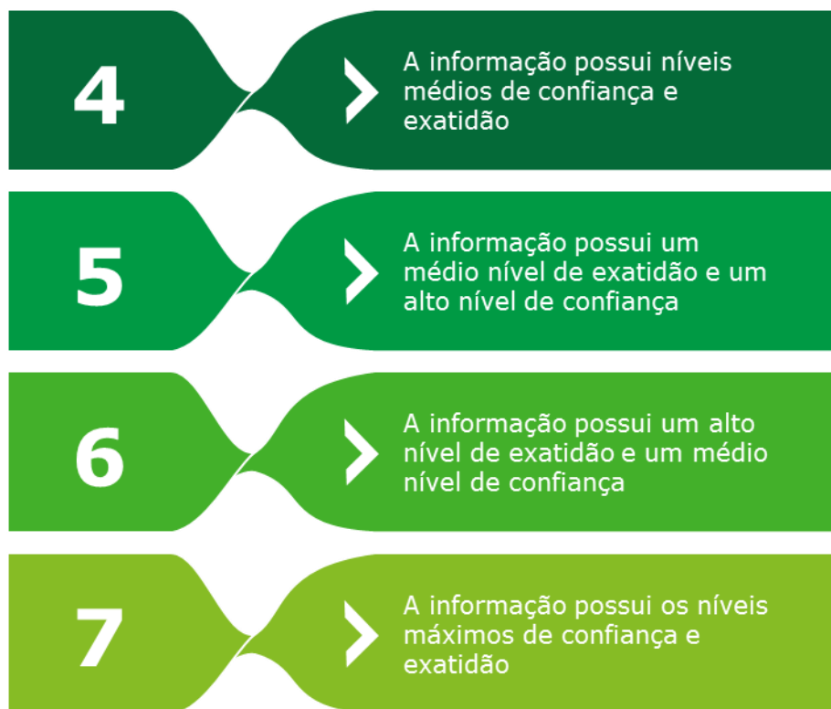
Figura 3 – Descrição das certificações atribuíveis às informações do SNIS